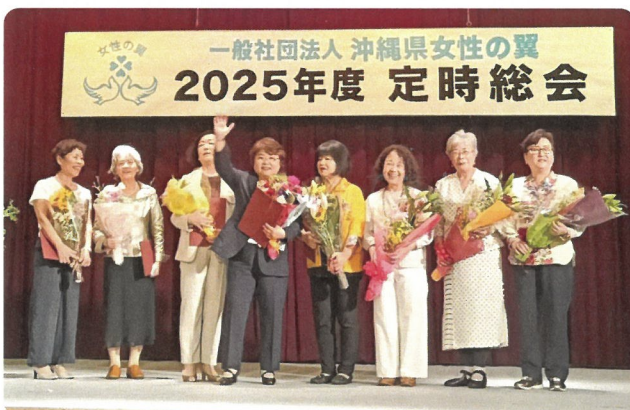
離任役員への感謝状及び花束贈呈