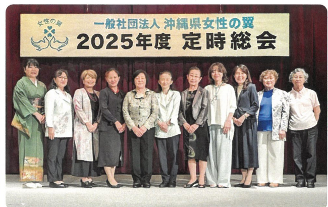
2025年定時総会で選任された役員(理事・監事)